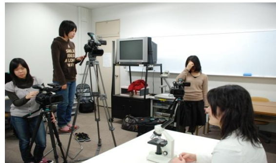
図3 顕微鏡の操作の撮影状況

そのことにより、より詳しく映像で見ることができ、基本的な捜査を覚えたり、観察の前に復習するための教材として作成した。