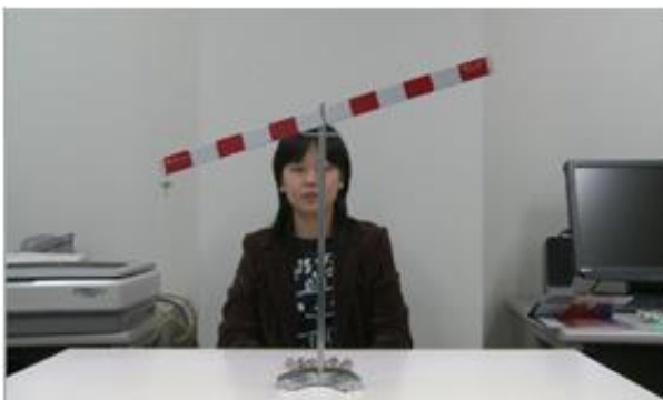
図1 てこ実験器の使い方

ここで開発した映像は、導入的映像。「てこの原理」の発見に導くための映像。「てこが水平につりあう時は、どんな場合だろうか？」という問いのもとに、いろいろにおもりを下げてる様子を見せる教材である。