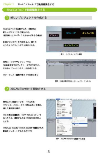
図 10 映像教材作成マニュアル