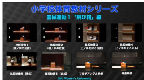
図9 DVDのメニュー画面

このように改善を重ね、最終的に8つの映像が入った教材を完成させた。作成した映像教材はDVDにまとめ、メニュー画面を見ただけで動画の比較内容がある程度把握できるように、視点別に整理された目次に、動画とリンクさせたサムネールを用意して、教師や児童が見たい動画を画面で選んで見ることが出来る方式にした。